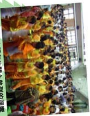
巡迴演出小朋友也開心熱烈的迴響