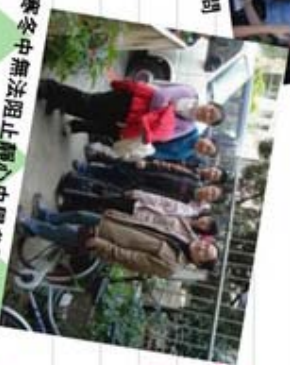
寒冬中無法阻止靜心中學參訪彩虹村