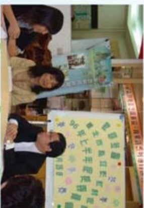
董事長與家長們分享討論