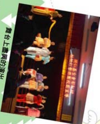
舞台上盡興的演出