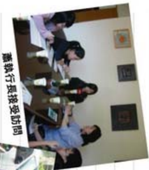
蕭執行長接受訪問

「如果你曾歌頌黎明，那麼也請你擁抱黑夜。」心智障礙者的勇敢及堅強是值得我們去讚許的，「只需一根針，就能縫合多少溫情的衣裳，只需一份真愛，就能化解重重障礙。」讓我們用愛一同關懷他們，為勇敢為與疾病打鬥的戰士們加油打氣吧！